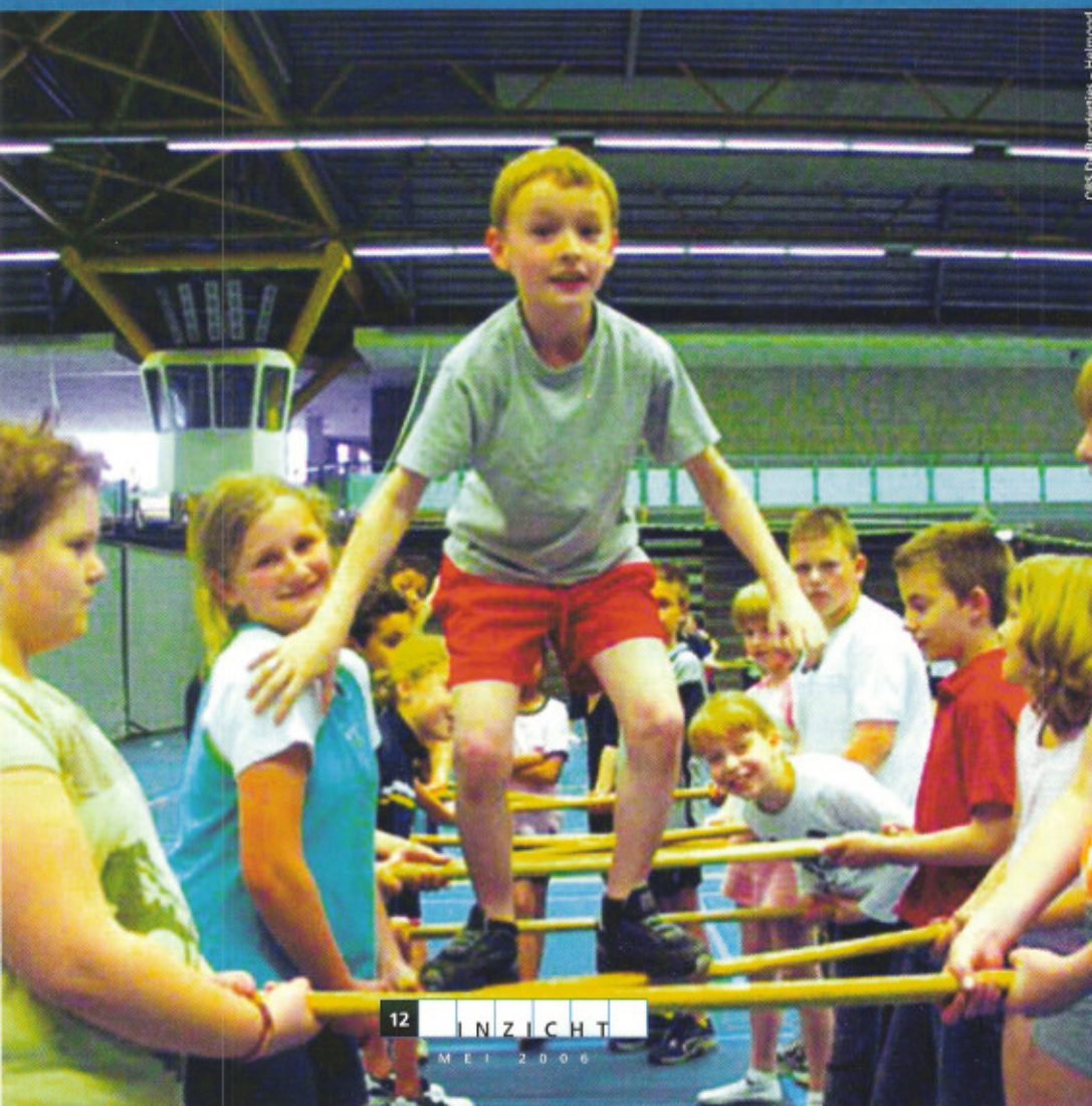
© 2006 De Blunderjies - Helmond